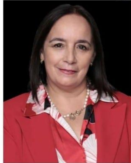
CARMEN GLORIA ARAVENA ES LA ÚNICA SENADORA QUE TIENE EL PARTIDO REPUBLICANO EN EL CONGRESO.

Aravena es actualmente la única senadora que tiene el Partido Republicano en el Congreso, y de ahí la relevancia que tiene para la colectividad que la legisladora cumple un papel preponderante en este ciclo electoral que se inicia y que será fundamental en el segundo intento de José Antonio Kast por llegar a La Moneda. CS