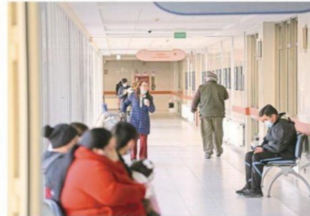
El Hospital Clínico se encuentra sin médico oncólogo desde enero de este año.

Frente a esta fragilidad, el gobernador Flies avizora que las soluciones para la región a me-