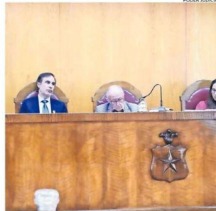
LA CORTE DE APELACIONES ENTREGÓ SU RESOLUCIÓN.

"Conforme a lo que se ha venido adelantando, resulta ser un hecho cierto que la recurrida ha actuado en forma ilegal y arbitraria con su conducta omisiva, violentando los de-