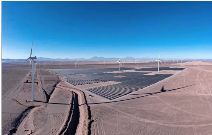
Desde la oposición acusan que se busca crear mayores potestades para el Ejecutivo en materia ambiental a la hora de evaluar los proyectos de inversión que se quieren desarrollar en el país.

Las DIA representan más del 90% de los ingresos al Sistema de Evaluación de Impacto Ambiental (SEIA) y suelen tener una menor envergadura. Asimismo, entre las innovaciones mencionadas está aquella que posibilita la revisión de las Resoluciones de Calificación Ambiental (RCA) obtenidas a partir de una DIA. El punto es que el legislador prevé este mecanismo excepcional solo para los EIA, dice la