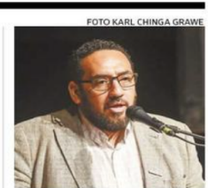
EL MINISTRO RESPONDIÓ.

Frutas de Chile y Senadores Provoste y Prohens buscan coordinar acciones para avanzar en una solución a la implementación del Systems Approach para los envíos de uvas chilenas a EEUU