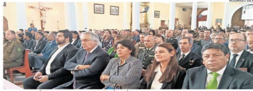
OBISPO DESTACÓ LA LABOR Y LA ENTREGA QUE DÍA A DÍA ENTREGAN CARABINEROS POR CHILE Y SU GENTE.

En la catedral de Copiapó no quedaba ningún espacio. Autoridades políticas de todos los sectores, representantes de las fuerzas del Orden y Seguridad y gran cantidad de ciudadanos estuvieron en la misa de recuerdo de los tres carabineros asesinados cruentemente en la localidad de Antiquina, en la zona sur de Cañete, Región del Bío Bío. Tras el minuto de silencio y