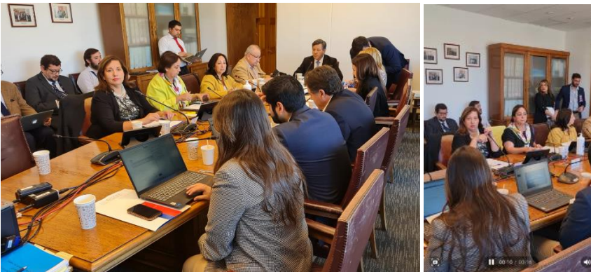
16/04/2024 Fotos y video comisión de Gobierno en Valparaíso