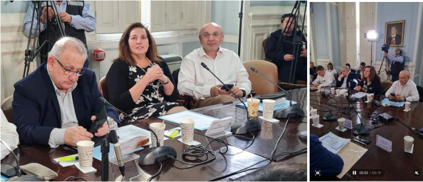
17/04/2024 Fotos y video comisión de Agricultura en Valparaíso