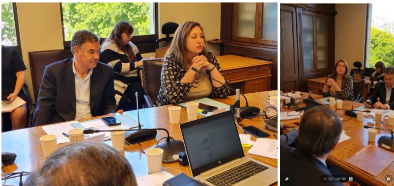
02/04/24 Fotos y video comisión de Gobierno en Valparaíso