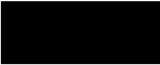
FIRMA SENADOR(A) REPRESENTANTE COMITÉ