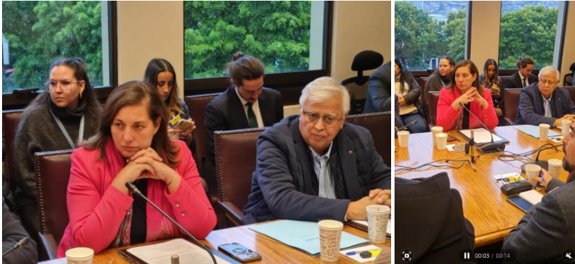
02/05/24 Fotos y video comisión mixta de Reincidencia