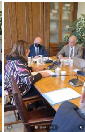
14/05/24 Fotos y video comisiones unidas de Defensa y Seguridad